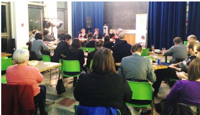
Photo : soirée parole citoyenne pour la démocratie scolaire, 23 octobre.

En collaboration avec l'organisme La Troisième Avenue, nous avons organisé un événement convivial dans le cadre des élections scolaires. L'activité a eu lieu le 23 octobre 2014, à l'Espace Lafontaine à Montréal.