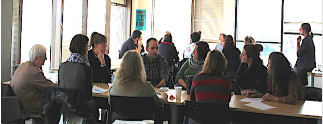
Forum régional sur le décrochage scolaire des filles en Montérégie.